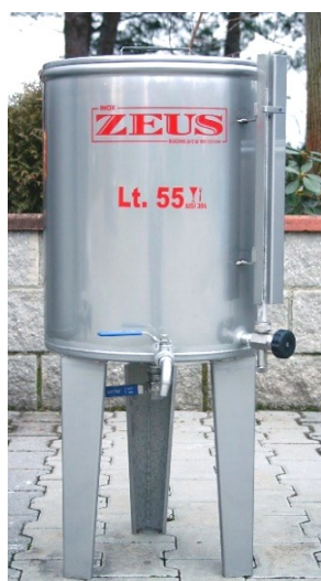
Z5/55 Finitura 2B