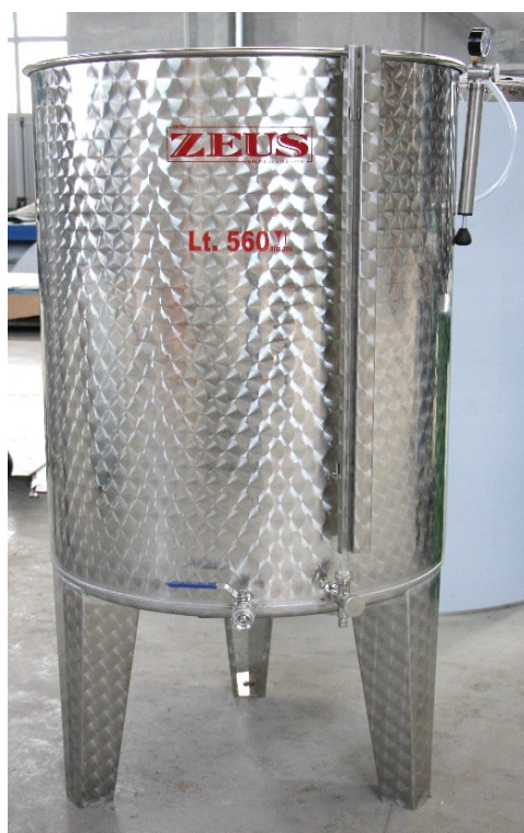
Finitura Lucida e Fiorettata

Fondo inferiore tipo Concavo Bordato con scarico totale al centro e gambe inox saldate.