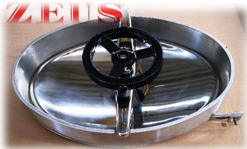
PORTELLA OVALE 440x310mm