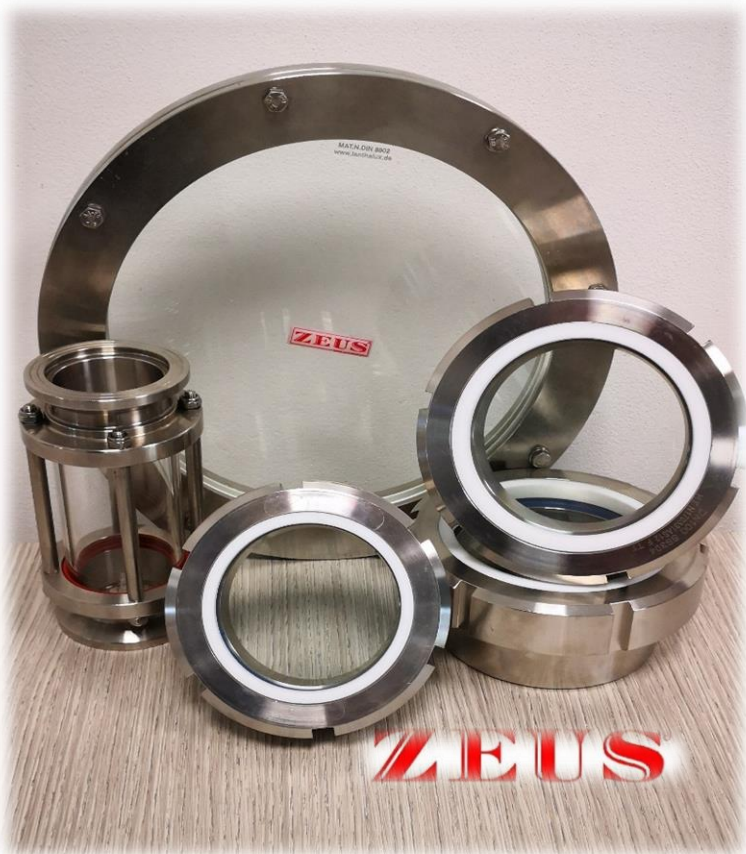
SPECOLE FLANGIATE - PASSAGGIO - DIN