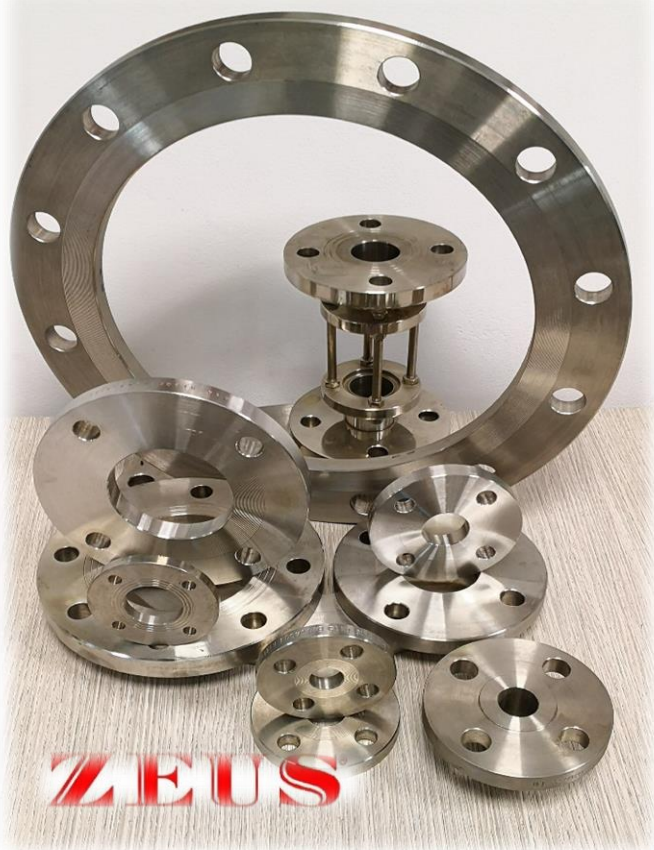
FLANGE PIANE - CON SCALINO - RIDOTTE - SLIP-ON - WELDING NECK