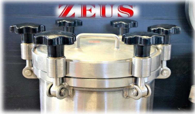
CHIUSINI A PRESSIONE ANCHE P.E.D.