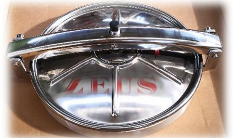
PORTELLA DA D=300mm A D=500mm